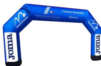
Arco da montare

Laddove partenza ed arrivo della gara non dovessero coincidere, alla partenza sarà sistemato l'arco, sull'arrivo il ragno.